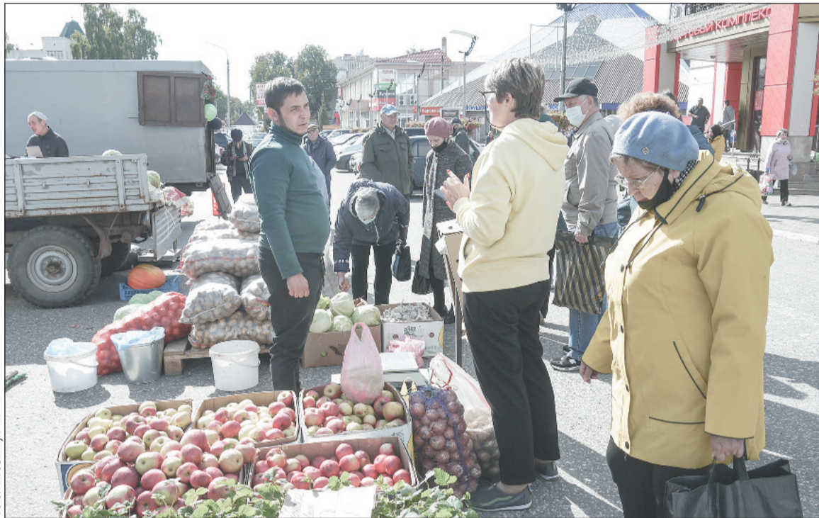
При покупке товаров во временных помещениях, на ярмарках, с лотков потребители также имеют право на получение обязательной информации о товаре

купли-продажи и договоров о выполнении работ (оказании услуг). Информация о товаре (работе, услуге), изготовителе (исполнителе, продавце) должна быть на русском языке, а дополнительно, по усмотрению изготовителя (исполнителя, продавца) на государственных языках субъектов или родных