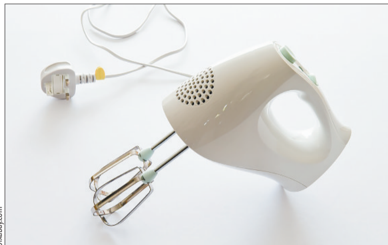
Любая бытовая техника боится скачков напряжения

если сгорела техника из-за скачка напряжения.