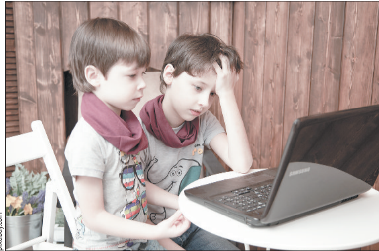
А вы знаете, что смотрят дети в ваше отсутствие?