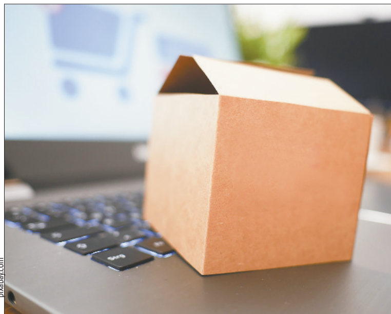
Не от всякой посылки есть возможность отказаться

Но даже если указанные документы отсутствуют, это не лишает его возможности сослаться на другие доказательства приобретения товара у данного продавца. Однако, если товар имеет индивидуально-определенные свойства и может быть использован исключительно приобретающим его потребителем, покупатель не вправе от него отказаться.