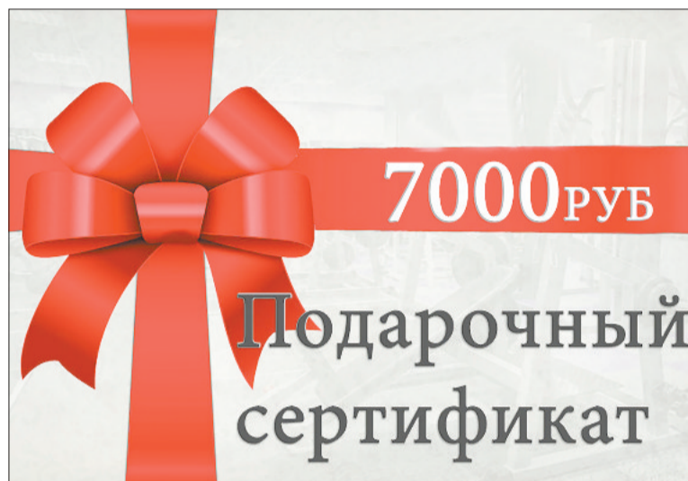
Решить вопрос о замене сертификата на деньги можно в суде

Пока товар еще не передан покупателю, продавец является его собственником, следова-